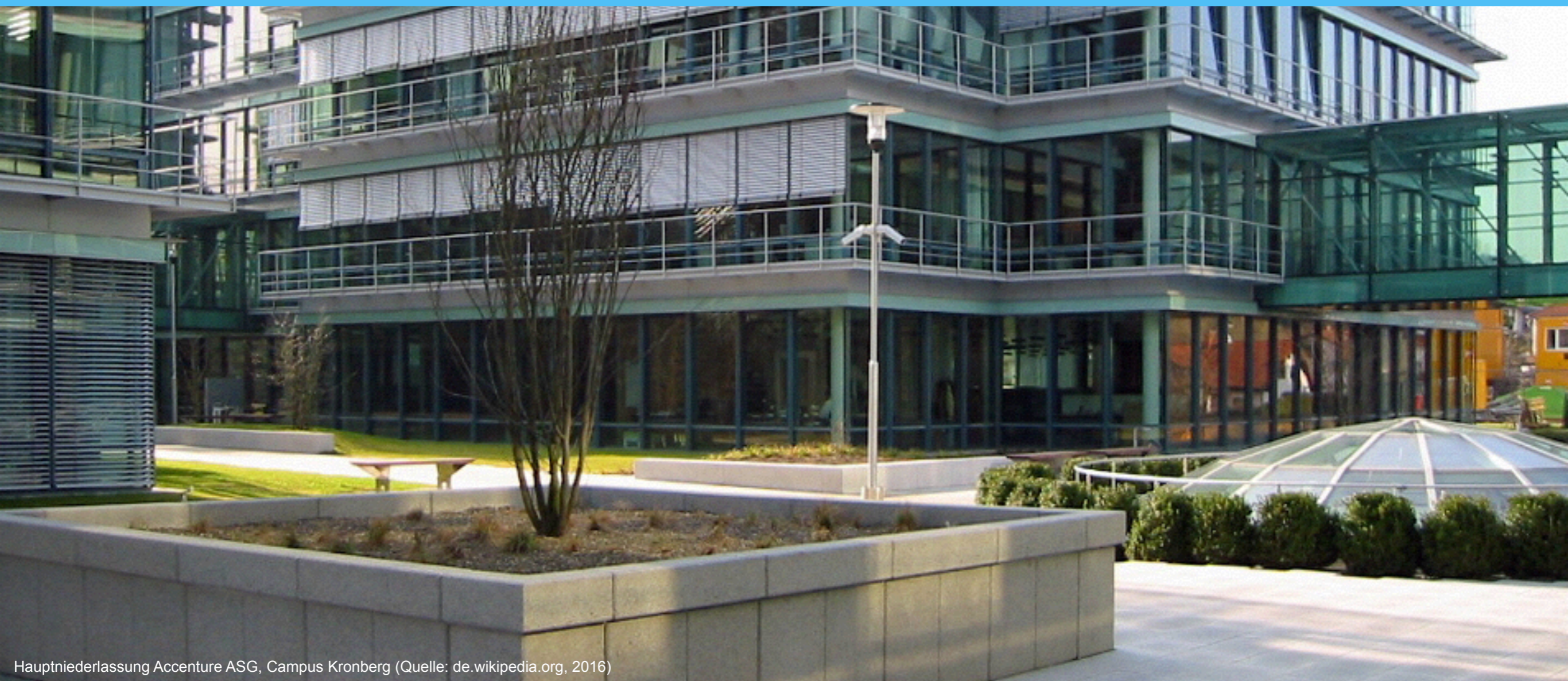
Hauptniederlassung Accenture ASG, Campus Kronberg (Quelle: de.wikipedia.org, 2016)